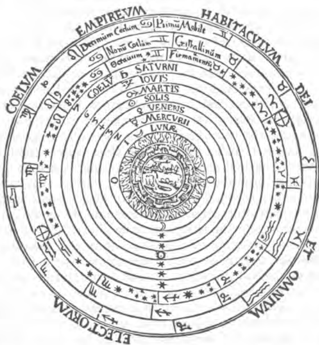
Fig. 1. Típico diagrama del universo precopernicano. (De la edición de 1539 de la Cosmographia de Pedro Apiano.)